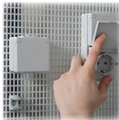
Rasterwand „Elektro“ (SE)