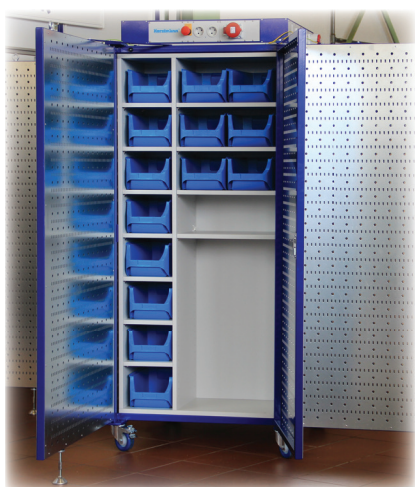
Variante „integrierter Lagerschrank“