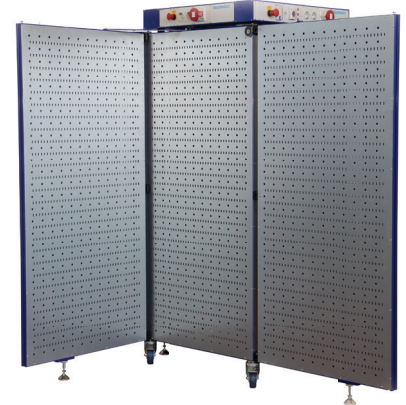
nutzbare Arbeitsfläche geöffnet: ca. (800 x 1.670 / 1.600 x 1.670) mm