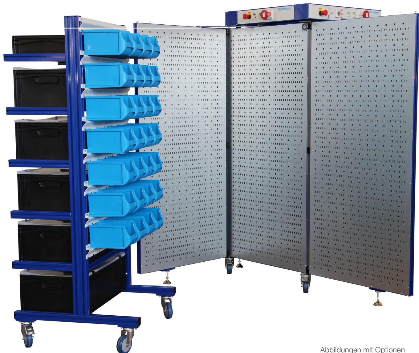
Abbildungen mit Optionen

Über den aufgesetzten Energiekanal wird die fachgerechte Elektroversorgung der Arbeitsplätze gewährleistet. Sonderbestückungen sind jederzeit möglich.