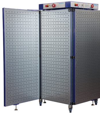
Platzbedarf geöffnet: max. (2.500 x 2.500 x 1.950) mm