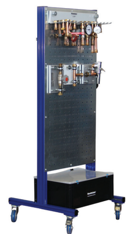
Option „Lagermobil - basics“