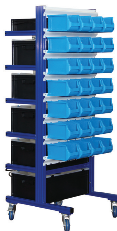
Variante „Orgamobil - basics“