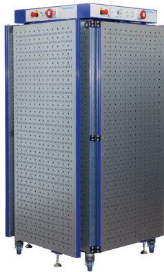
Platzbedarf Lagerposition: ca. (900 x 900 x 1.950) mm