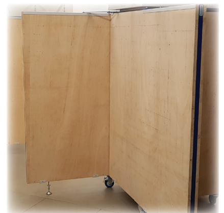
Beplankung „Mehrschicht-Holzplatte“ (H)